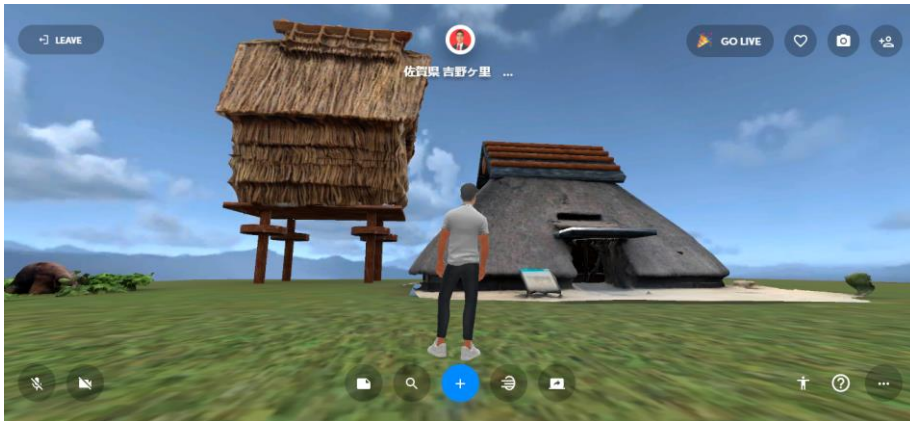
佐賀県庁 吉野ケ里