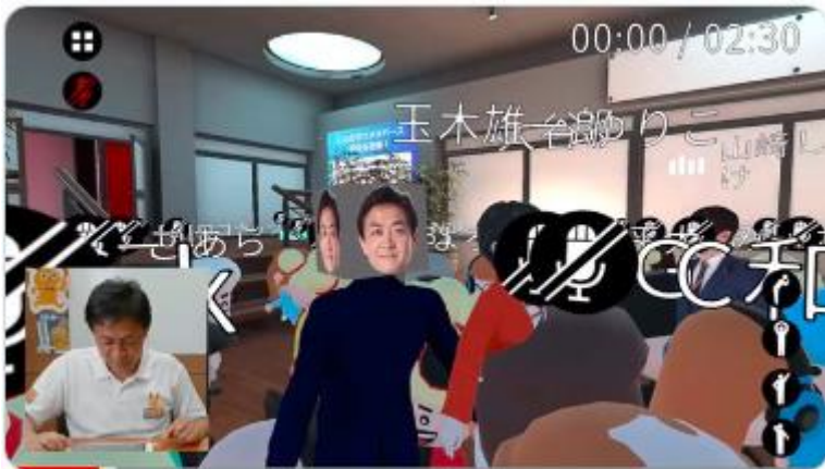
国民民主党 玉木雄一郎代表のメタバー

※自民党は他社だったが、 ・立憲＝東武、 ・維新＝東武、 ・国民＝東武、 と東武トップツアーズは3党から受注した。