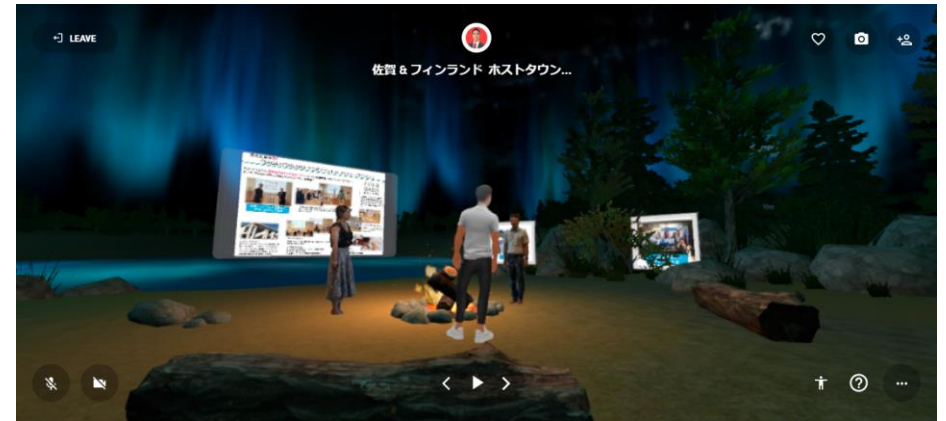
ホストタウン フィンランド