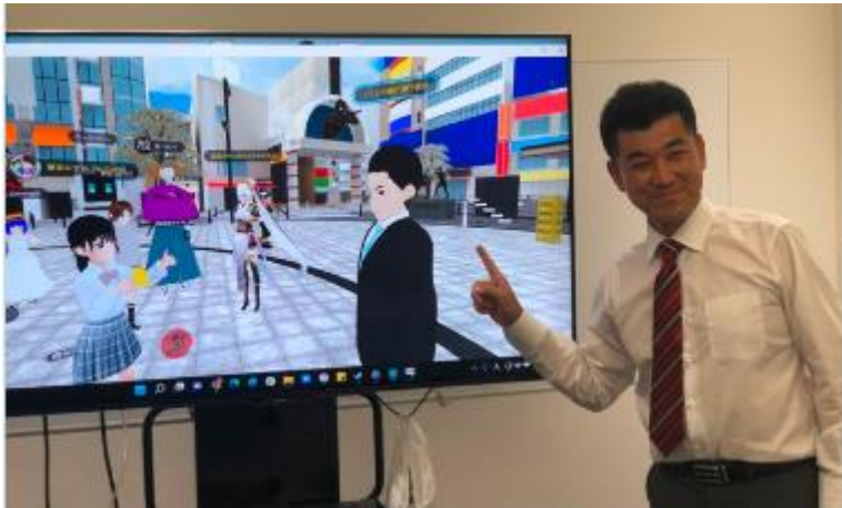
立憲民主党 泉健太代表のメタバー