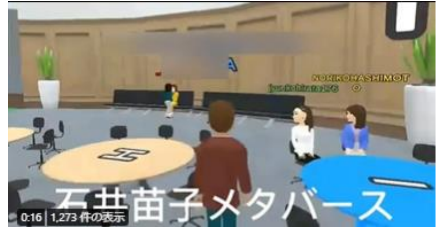
日本維新の会 石井苗子参議院議員のメタバー